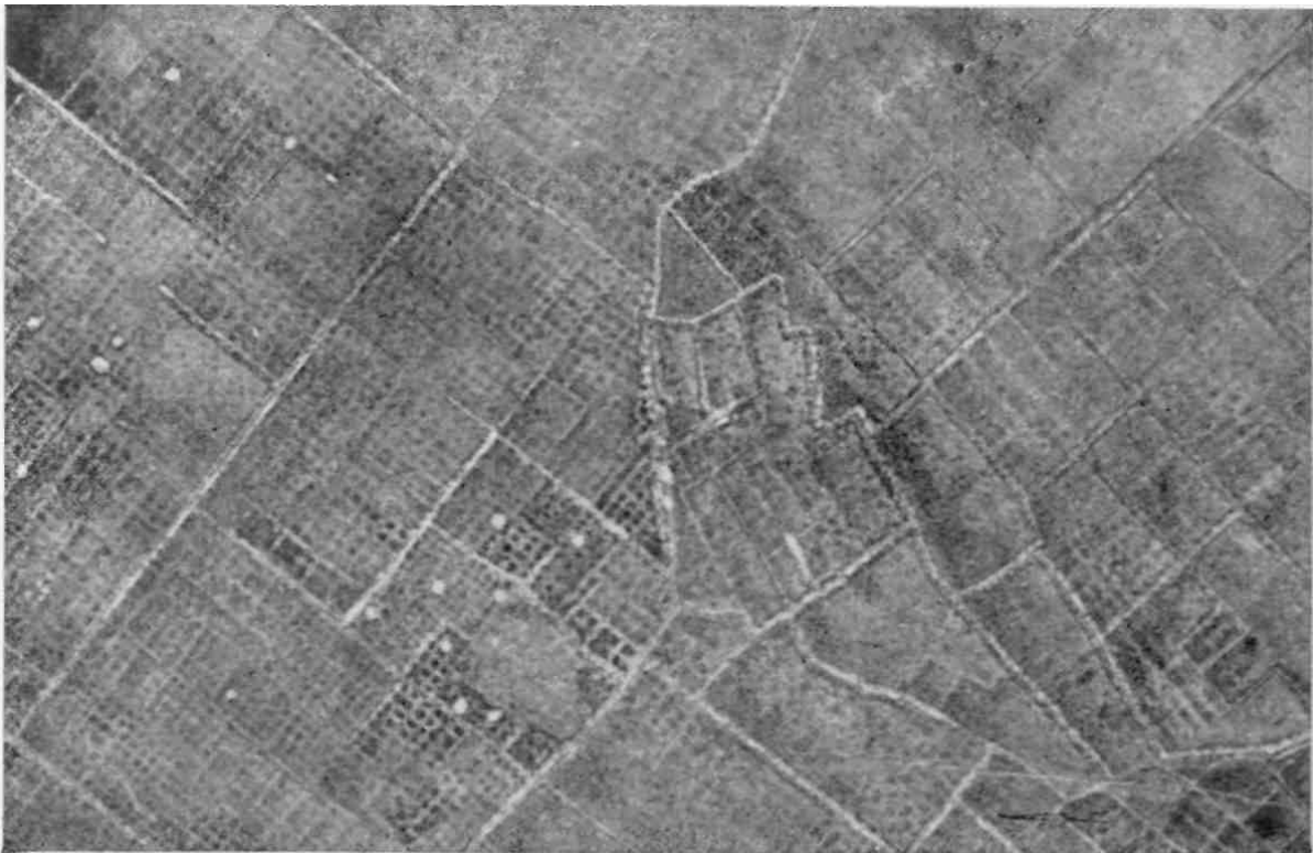
8 Fliegeraufnahmen über Nordafrika zeigen Plantagen aus der Römerzeit. Africa proconsularis war das reichste Land der Erde. Aus 4000 Meter Höhe werden heute noch die Äcker unter der jetzigen Erdschicht sichtbar. Man kann genau die Wege und die Standorte der Olivenbäume unterscheiden.