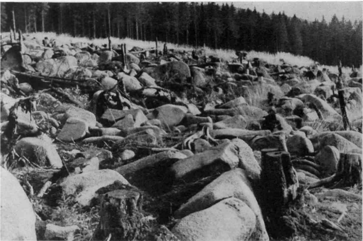
7 Bodenerosion drei Jahre nach Großkahlschlag über undurchlässigem Gestein (Karpathen).