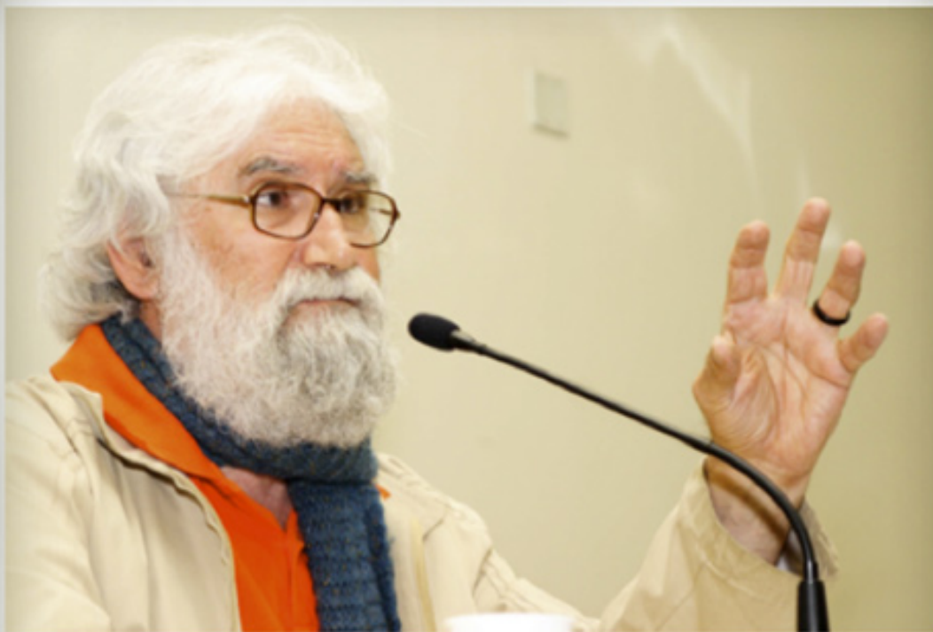
Leonardo Boff, known Marxist, former priest and one of the founders of Liberation Theology, is one of Francis' (Jorge Mario Bergoglio) most ardent supporters.