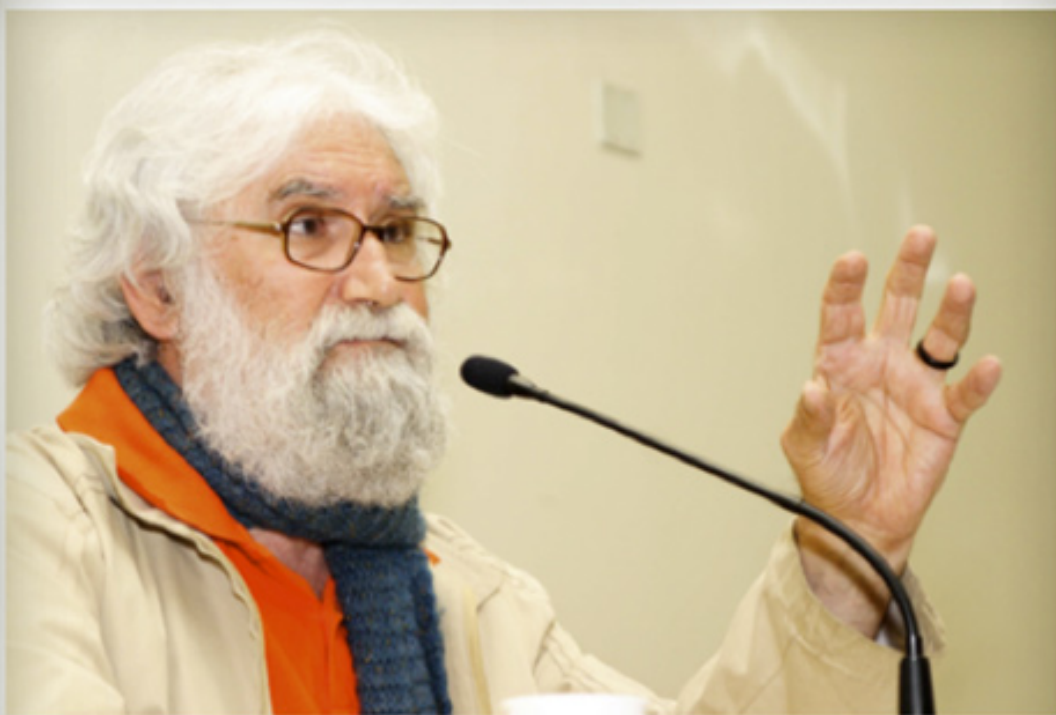
Leonardo Boff, known Marxist, former priest and one of the founders of Liberation Theology, is one of Francis' (Jorge Mario Bergoglio) most ardent supporters.