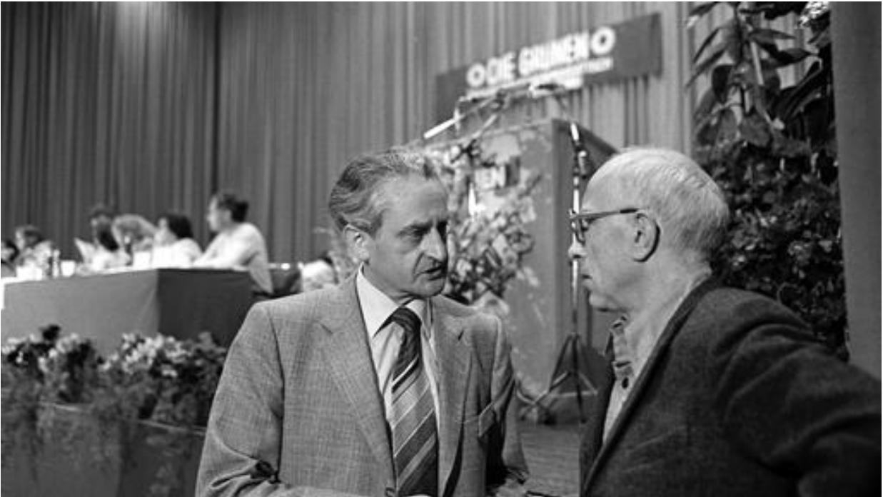
Herbert Gruhl und Carl Amery bei den GRÜNEN