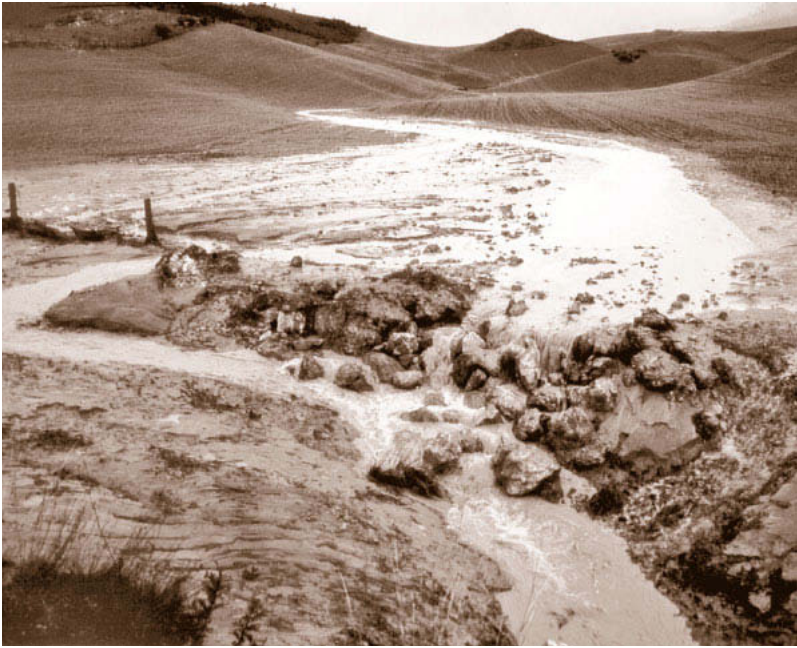
1 Liegen Ackerflächen brach, hat das Wasser leichtes Spiel: Bereits bei geringsten Hangneigungen setzt Bodenerosion ein.

haben, lesen können, um festzustellen, ob eine nachhaltige Gesellschaft überhaupt möglich ist.