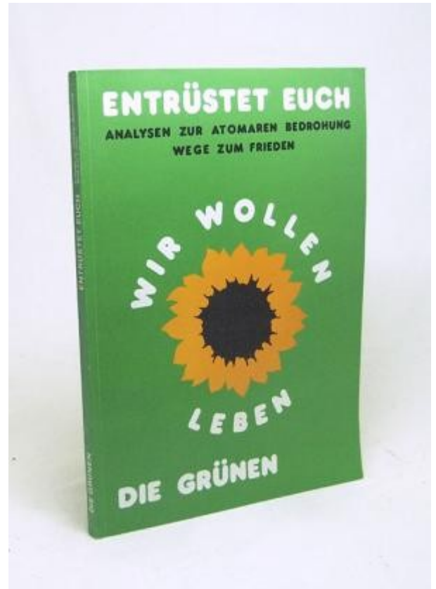
1982 - hier auch publiziert.

Waffen sind Dinge, und Strategien sind die instrumentellen Pläne, um politische Entscheidungen umzusetzen, die anderswo herkommen. – Also müssen wir uns in der Analyse auf die herrschenden Eliten und ihre politischen Absichten konzentrieren. Den Rest können wir dann als gegeben betrachten.